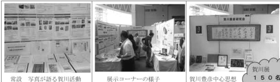
常設 写真が語る賀川活動