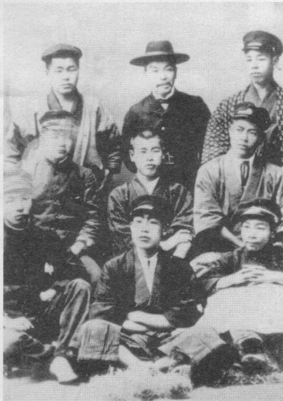
学生服の賀川豊彦